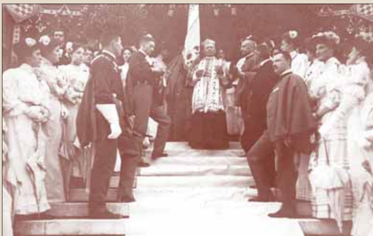
Posveta zastave Hrvatskog sokola ispred Umjetničkog paviljona povodom I. hrvatskog svesokolskog sleta 1906. godine

Članstvo u organizaciji hrvatski sokoli nisu uvjetovali nacionalnim porijeklom ili vjerskom pripadnošću. Međutim, u njihovim je redovima bilo malo članova koji nisu bili naklonjeni Katoličkoj crkvi. U novonastaloj situaciji oni su dobili priliku da progovore. Središnji odbor Hrvatskog sokola je, raspravljajući o odnosu s Crkvom, 1921. godine odlučio da ne potencira sukob i da po svaku cijenu zadrži prijašnje dobre odnose. Međutim, u Katoličkom listu i dalje se pisalo o postupcima sokolske organizacije usmjerenim protiv Crkve. Biskupi su u svojoj poslanici upućenoj vjernicima 1921. godine prosvjedovali protiv Mariborske rezolucije. Taj je prijedor ponajprije bio upućen Jugoslavenskom sokolskom savezu, ali i hrvatskom sokolstvu. Vodstvo hrvatske sokolske organizacije nije podržavalo politiku Jugoslavenskog sokolskog saveza, ali se o tome nije javno izjašnjavala. Crkva je željela potaknuti Hrvatski sokol da se odlučnije suprotstavi novom kursu.